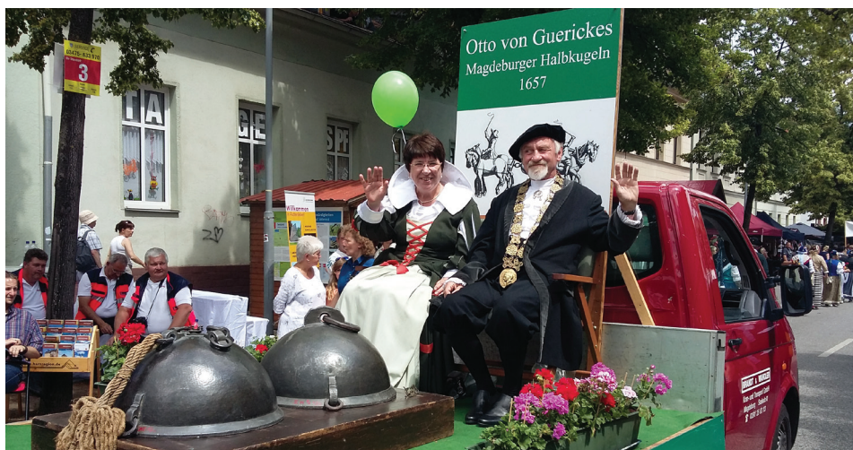
Unser Wagen mit den bestens bekannten Darstellern Otto von Guericke und seiner Frau, dem Ehepaar Unewski, während des Festumzugs auf dem Sachsen-Anhalt-Tag in der Lutherstadt Eisleben.