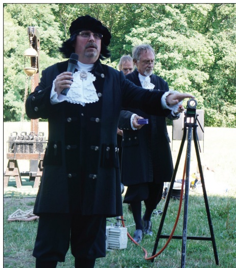
Vakuum-Windbüchse zum Zielschießen.

Verfahren zur Elektronenmikroskopie, miniaturisierte elektrische Antriebe für Raumfahrzeuge, neue elektronische Bauteile, wie auch die photo-unterstützte Feldemission unter dem Einfluss von ultrakurzen Laserpulsen oder der Übergang von der Elektronen-Feldemission zu stabilen Gasentladungen in Mikroplasma sowohl im Vakuum und auch bei Atmosphärendruck.