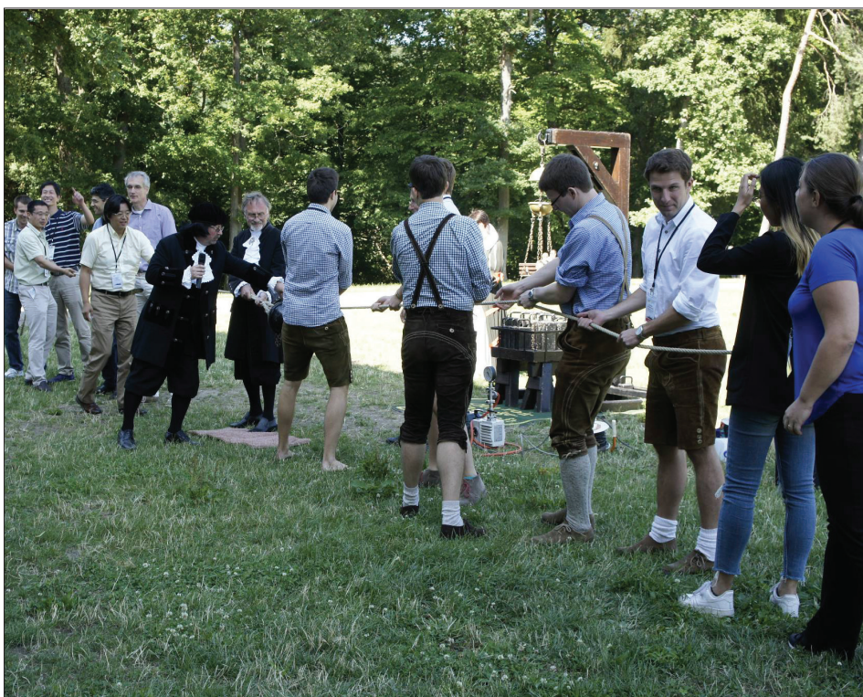
Tauziehen mit den kleinen Magdeburger Halbkugeln, wobei das bayerische Organisationskomitee (mit Lederhosen) gegen das internationale Wissenschafts-Komitee angetreten war.