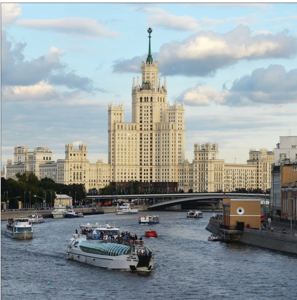
Impressionen einer beeindruckenden Stadt, im Hintergrund die Lomonosow-Universität.

Die Besichtigung der Stadt Moskau erwies sich als herausragendes Erlebnis. Die berühmten Kathedralen, Paläste und