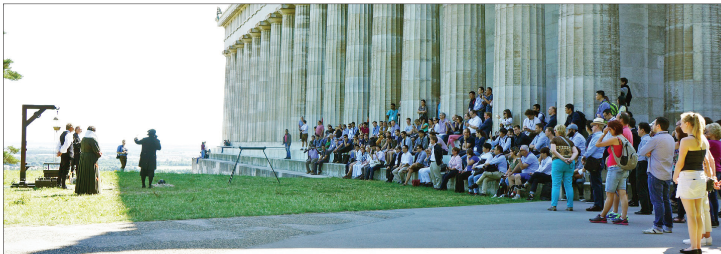
Guerickes Abriss-Versuch am Galgen vor der Walhalla mit den kleinen Magdeburger Halbkugeln.

Vom 10. bis 14. Juli 2017 fand im Hergzogssaal Regensburg die fünftägige „The 30th International Vacuum Nanoelectronics Conference 2017 (IVNC 2017)“ statt. Diese Konferenzserie begann 1988 in Williamsburg/USA. Der Veranstaltungsort wechselt jährlich in regelmäßiger Reihenfolge zwischen Nordamerika, Europa und Asien. Im Jahr 2017 fand die inzwischen 30. Tagung zum dritten Mal in Deutschland statt – nach 1999 in Darmstadt und 2011 in Wuppertal.