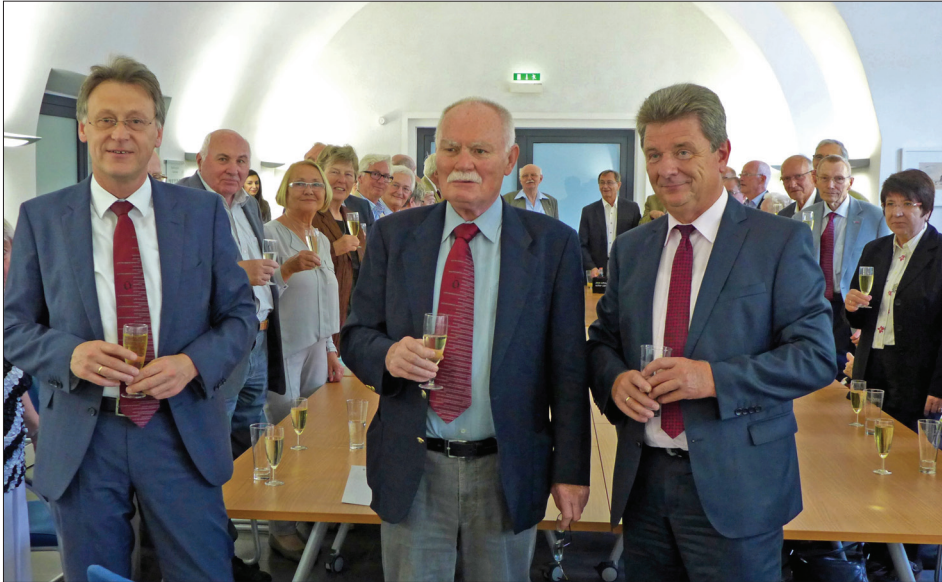
Ein Prosit auf 25 Jahre Otto-von-Guericke-Gesellschaft im Rathaus.