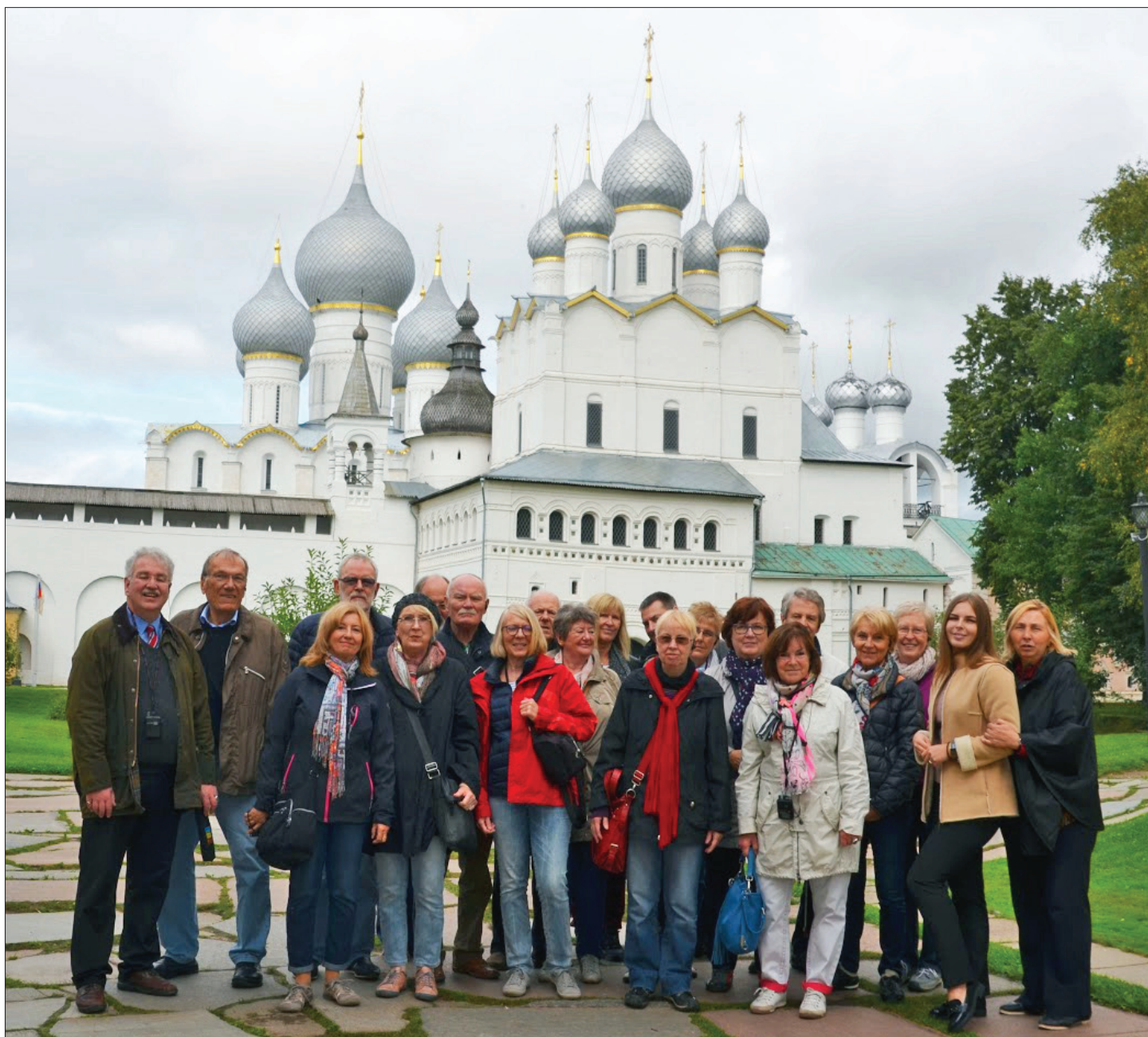
Gruppenfoto vor dem Erlöser-Euthymios-Kloster (Спасо-Евфимиев монастырь) in Susdal - Hauptstadt des Goldenen Rings.