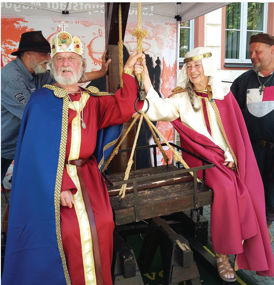
Auch „Kaiser Otto und seine Frau Editha“ machten mit beim Hubversuch.