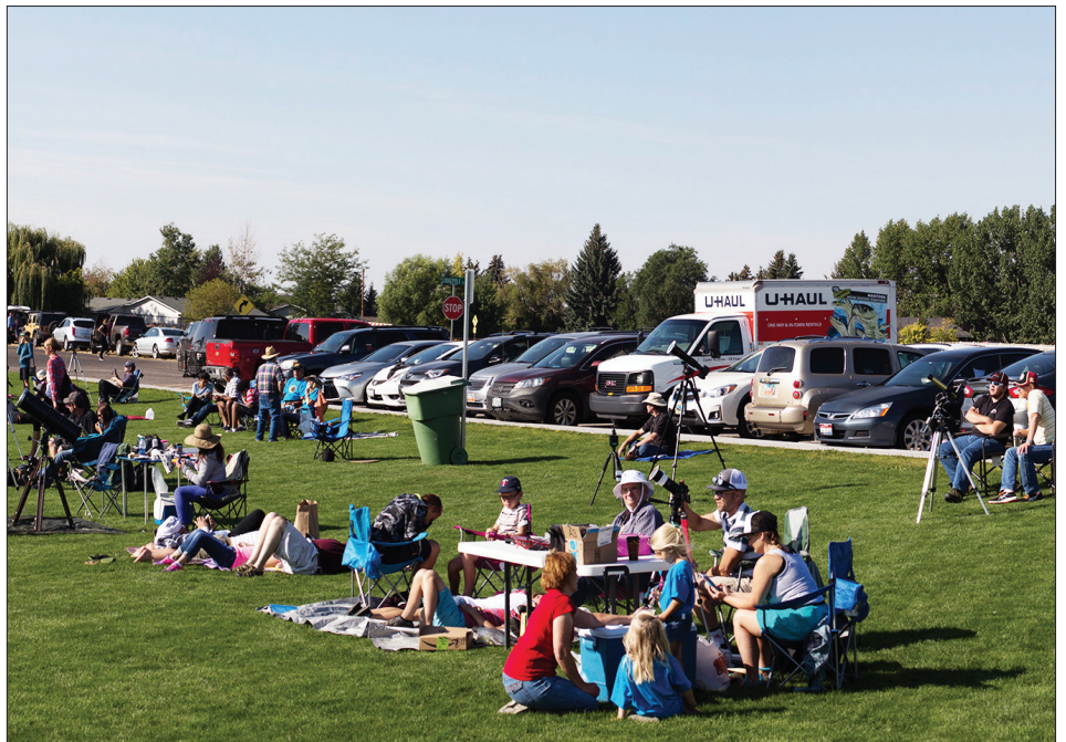
Universitätsstadt Rexburg - Publikum.

Die Mondscheibe begann sich dann ab 10:15 Ortszeit vor die Sonne zu schieben und die Helligkeit nahm zunächst nur langsam ab. Was dann aber kurz vor Beginn der totalen Phase um 11:30 Ortszeit passierte, ist einfach unbeschreiblich. Die Menschen auf unserem Platz begannen an zu jubeln, zu weinen und zu schreien. Auch uns hat es völlig mitgerissen und wir standen mit offenem Mund da und beobachteten zuerst den Diamantringeffekt und dann die wunderschöne Sonnenkorona. Viele Menschen waren von der Sonnenkorona so überwältigt. Mittlerweile war es so dunkel wie